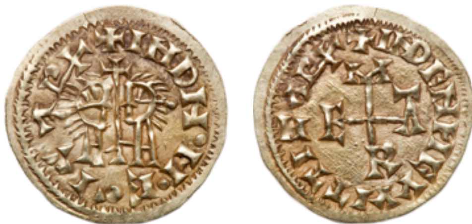
Moneda de Egica y Witiza. Ceca de Mérida. Nº 10131362 22 .

En el nombre de Dios, Witiza, Rey / Taller o Ceca de Mérida