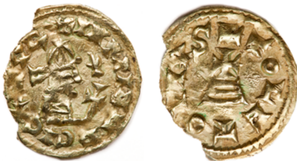
Moneda de Egica. Ceca de Toledo. Nº 10131363 20 .

De nuevo, aparece la ceca de Toledo, capital del reino hispanovisigodo, una de las localidades con más emisiones a lo largo de todo este período.