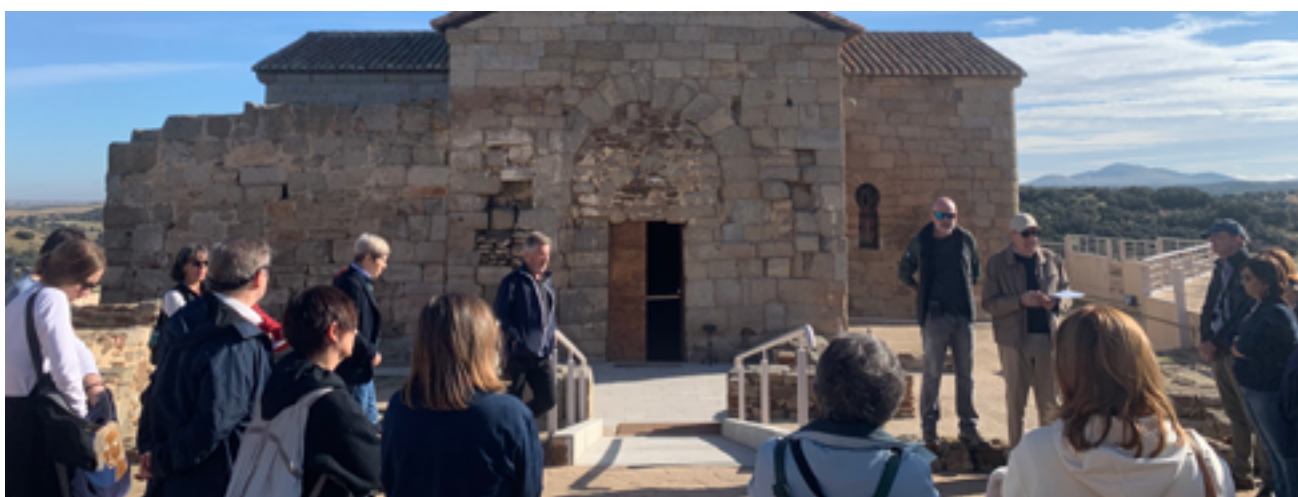
52 CINCUENTA AÑOS DE INVESTIGACIÓN EN SANTA MARÍA DE MELQUE. HISTORIA, CIENCIA Y LEGADO REUNIDOS EN EL MUSEO ARQUEOLÓGICO NACIONAL Marta Rielo Ricón - Marina Forte Cutillas