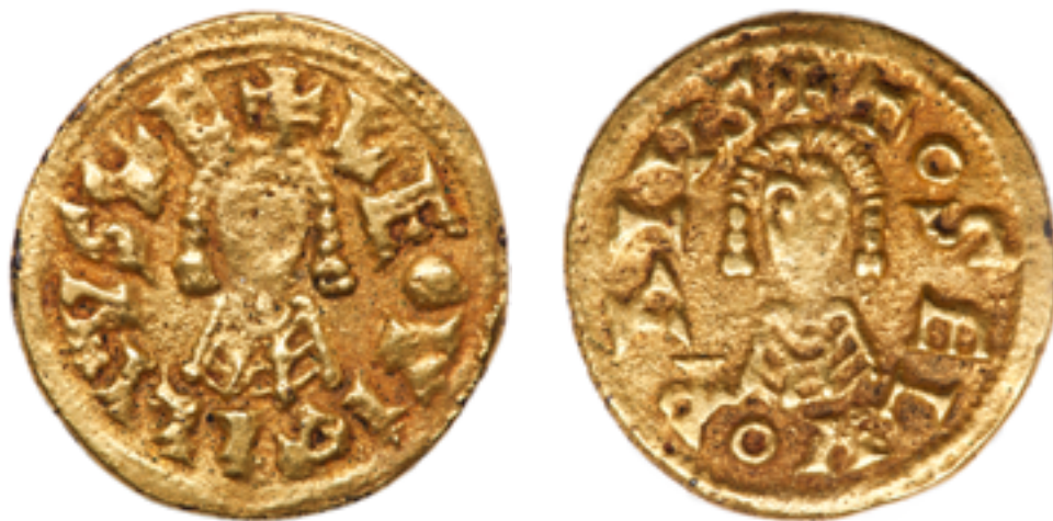
Moneda de Leovigildo. Ceca de Elvora. Nº 10131355 10 .

Justo, Taller o Ceca de Elvora (probablemente la actual Talavera de la Reina)