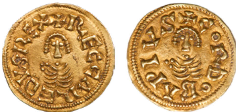
Moneda de Recaredo. Ceca de Córdoba. Nº 10131356 12 .