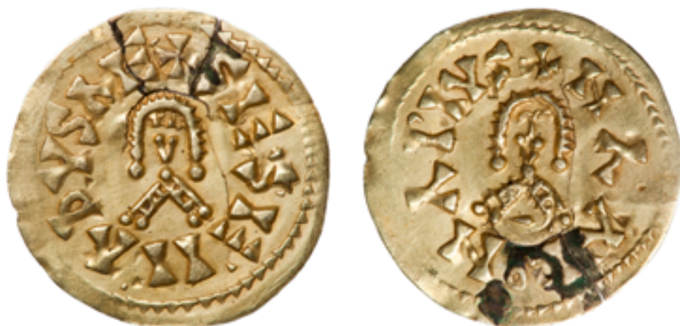
Moneda de Sisenando. Ceca de Narbona. Nº 10131359 15 .

Módulo: 20,40 mm. Peso: 1,28 gr. Pieza igualmente frágil y endeble. Se observan dos grietas en la parte superior del anverso.