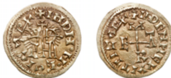
Posición de cuño: a las 12 7 . Moneda de Egica y Witiza acuñada en Emerita. Nº inventario: 10131362