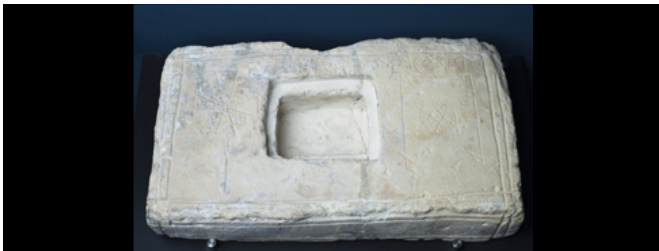
44 EL ALTAR CRISTIANO EN ÉPOCA VISIGODA. REFLEXIONES DESDE LA ARQUEOLOGÍA Y LA HISTORIA DEL ARTE Isaac Sastre de Diego