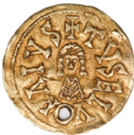
Moneda de Recaredo. Ceca de Elvora. N° 10131357 13 .

Módulo: 16,40 mm. Peso: 1,5 gr. Muy poca variación en el tamaño respecto a las otras monedas.