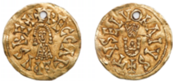
Posición de cuño ( en el anverso ): a las 6 6 . Moneda de Recaredo acuñada en Elvora. Nº inventario: 10131357

a las 12, por lo tanto, es la única donde no aparece invertido el tipo del reverso respecto al anverso 5 .