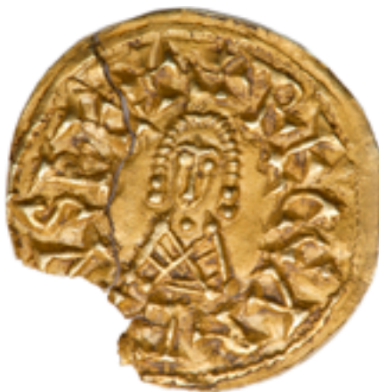
Moneda de Recaredo. Ceca de Elvira. N° 10131358 14 .

Módulo algo mayor: 17,85 mm. Peso: 1,27 gr. Flan más delgado, endeble y frágil, que ha provocado que se encuentre muy dañada, fragmentada y con pérdida de materia.