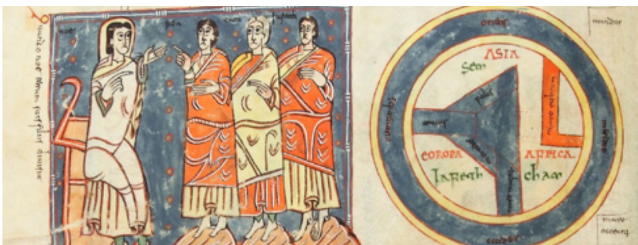
68 NOTICIAS DE INTERÉS PARA LOS VIAJEROS A LA TARDOANTIGÜEDAD Paz Cabello Carro