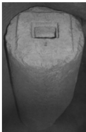
Fig. 11. Ara cilíndrica con loculus (Sastre 2013, 266)

Dentro de la producción escultórica, Isaac Sastre de Diego ya había analizado parte del mobiliario litúrgico al concentrar su trabajo en los altares como objetos arqueológicos (Sastre 2013). Diferenciando cuatro contextos para su estudio —hallazgo in situ , reutilizado in situ , desacralizado y descontextualizado— identificó, en la iglesia de Santa María de Melque, tres altares que pudo relacionar con dos de las fases cronológicas que la arqueología había documentado. Según su tipologización, uno de los altares prismáticos correspondería a la primera fase del edificio, fechada en el siglo VIII, mientras que a la segunda fase, vinculada a la reforma litúrgica del siglo IX, se atribuirían las dos huellas circulares de las estancias laterales al anteábside, así como el ara cilíndrica con loculus actualmente ubicada en la capilla norte de la iglesia. Cabe destacar que no se halló rastro de ningún ara única con cruz patada, tipología más extendida en la arquitectura eclesiástica del siglo VII.