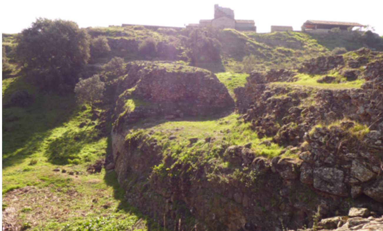
Fig. 13. Presa denominada «Melque IV». Vista del alzado aguas abajo.

Sin olvidar el imprescindible diálogo entre los resultados proporcionados por la geología y los del análisis arqueológico de la arquitectura y del paisaje, los patrones de explotación resultantes permiten progresar en el conocimiento de los talleres constructivos de Melque. Una cuidada selección de materiales, así como una optimización de recursos que distinguió los materiales según su naturaleza y funcionalidad, desvela una fuerte especialización en los talleres que construyeron el monasterio.