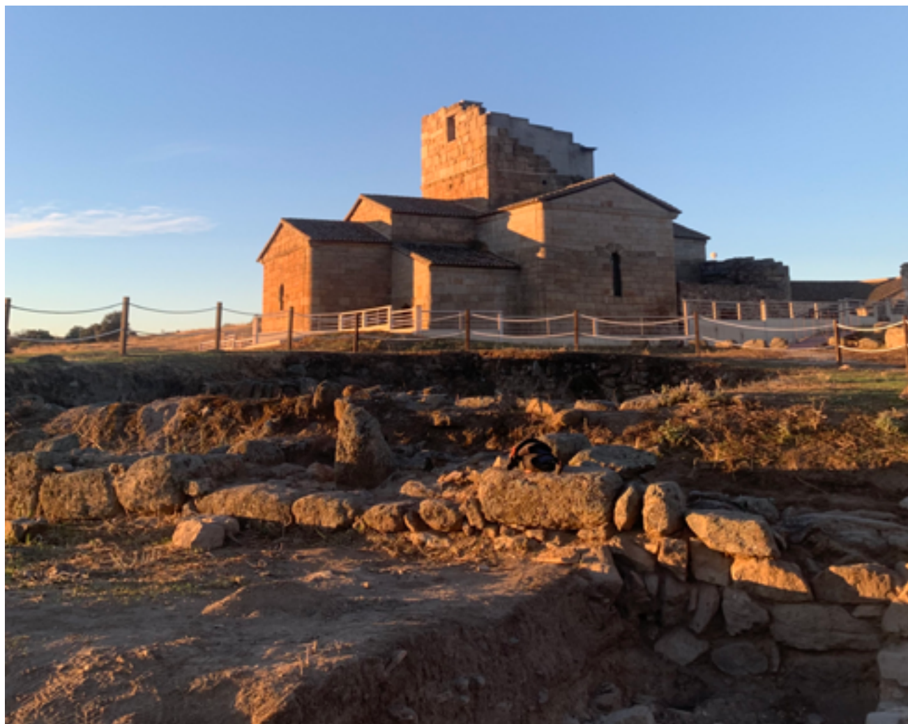
Fig. 8. Vista de la iglesia desde las excavaciones de la campaña de 2024.

definimos actualmente es diferente a todos los anteriores, y el yacimiento que comprenderemos en los próximos años de investigación será otro del que conocemos hoy. Este cambio continuo es el resultado del avance metodológico, que transforma el monumento en un yacimiento en constante evolución.