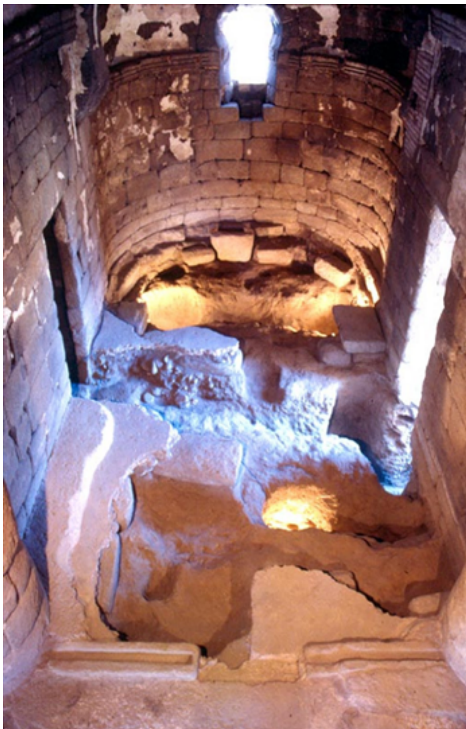
Fig. 5. Paso del crucero al anteábside en Santa María de Melque. Excavaciones de 1970-1973.

Dos décadas más tarde, durante la segunda campaña de excavaciones, la aplicación del método Harris redefinió profundamente el conjunto de Santa María de Melque, inaugurando una nueva etapa en su comprensión. Se produjo entonces otro cambio de paradigma, esta vez interpretativo, al formular una nueva teoría que adscribía a lo mozárabe parte de las iglesias que se habían considerado —a partir de una metodología «pre-arqueológica»— de época visigoda.