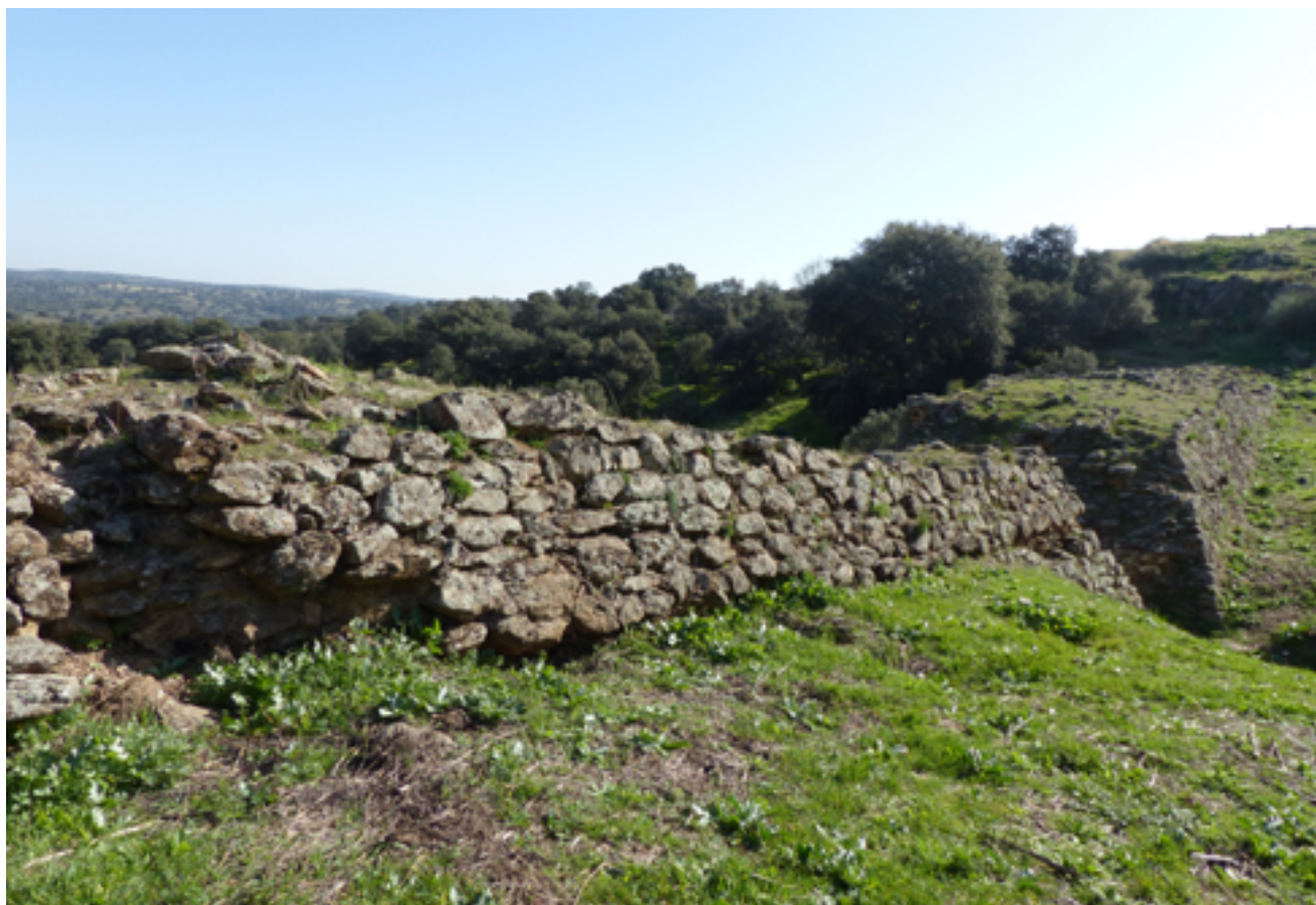
Fig. 12. Presa identificada como «Melque II».

Este análisis se complementa con los últimos resultados del estudio arqueológico de las presas que rodean el monasterio, el cual revela una estrecha relación con la actividad ganadera. Aunque Caballero Zoreda ya había realizado un análisis preliminar del paisaje y de los morteros empleados en las presas, su propuesta carecía de estudios estratigráficos y tipológicos que permitieran datarlas con precisión. Este vacío metodológico ha sido abordado recientemente con los trabajos de Marisa Barahona Oviedo (2023), quien ha replanteado el conjunto hidráulico de Melque mediante un enfoque interdisciplinar que integra estratigrafía, tipología y un análisis detallado del paisaje histórico. La arqueóloga recogió en su conferencia titulada «El paisaje hidráulico de Melque» sus resultados, presentando una evolución histórico-cronológica para las presas que diferencia tres fases dentro del horizonte medieval al tiempo que revisa las