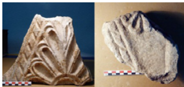
Fig. 10. Fragmentos de tablero de cancel hallados en la iglesia de Santa María de Melque (Villa 2021, 489)