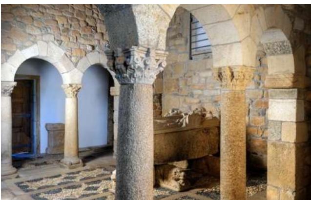
Interior DE LA CAPILLA

https://origenesdeeuropa.eu/patrimonio/portugal/iglesia-de-sao-pedro-de-balsemao/