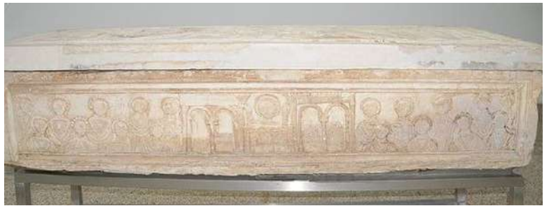
Sarcófago de la tumba atribuido a Sao Martinho de Dume (Braga)