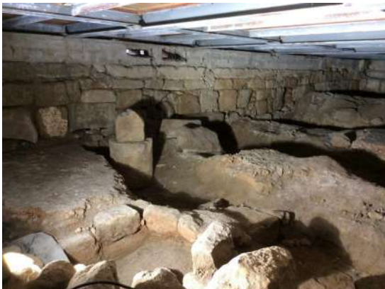
Restos arqueológicos de la basílica

https://origenesdeeuropa.eu/patrimonio/portugal/sao-martinho-de-dume/