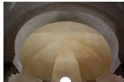
SAN CEBRIÁN DE MAZOTE: DETALLE DE LA CABECERA