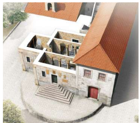
RECONSTRUCCIÓN DE LA CAPILLA