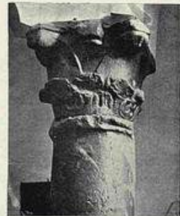
Capiteles visigodos de la Iglesia de Santa Eulalia—Fragmento de friso procedente de la Basílica de Santa Leocadia (Museo Arqueológico Nacional) Chapiteaux visigoths de l'Eglise de Sainte Eulalie—Fragment de frise de la Basilique de Sainte Leocadie (Museo Arqueológico Nacional)