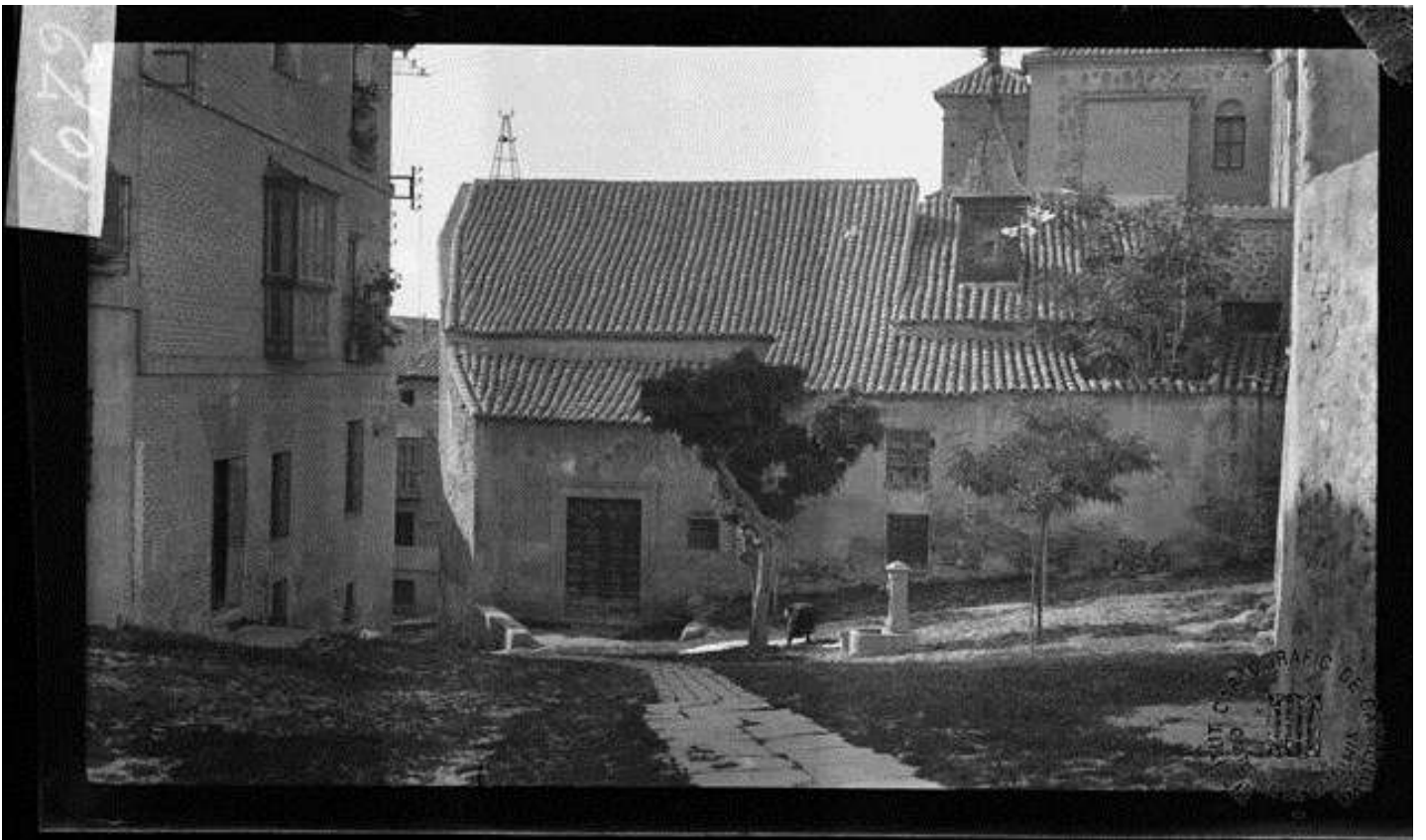
en 1933 por Gonzalo de Reparaz . Del blog Toledo olvidado